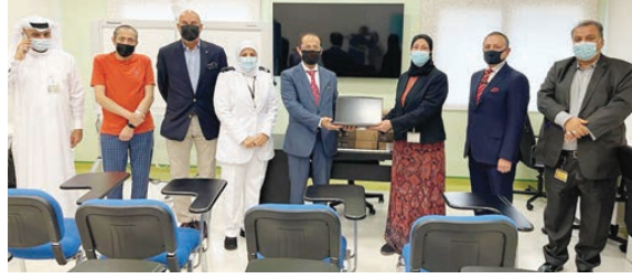
○ ورتاري المنامة يقدم تجهيزات لمركز أبحاث أمراض الدم الوراثية.