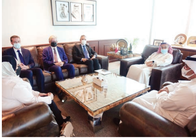
○ رئيس الأعلى للصحة مع سفير الجمهورية الفرنسية.

البحرين وجمهورية فرنسا، كما أثنى على الدور البارز الذي يقوم به المجلس الأعلى للصحة في تطوير قطاع الرعاية الصحية في البحرين مؤكدا استعداد الجانب الفرنسي لتنمية آفاق التعاون الصحي المشترك بين البلدين الصديقين.