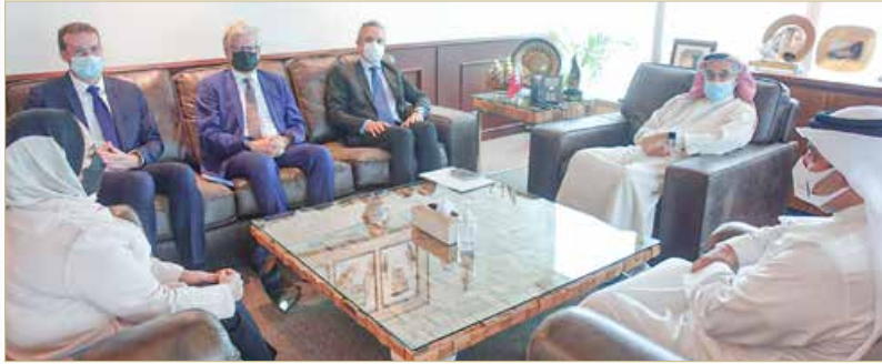
رئيس المجلس الأعلى للصحة يستقبل السفير الفرنسي

المتميز من العلاقات التي تربط مملكة البحرين وجمهورية فرنسا، كما أثنى على الدور البارز الذي يقوم به المجلس الأعلى للصحة في تطوير قطاع الرعاية الصحية في البحرين مؤكداً استعداد الجانب الفرنسي لتنمية آفاق التعاون الصحي المشترك بين البلدين الصديقين.